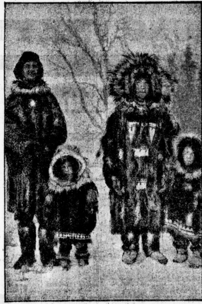
Die Abgeschiedenheit der in Alaska lebenden Europäer von der Welt der Weigen hat häufig Ehen mit Ostindianern zur Folge. Unser Bild zeigt einen amerikanischen Minenarbeiter mit seiner Familie.

Heute findet man unter den Eingeborenen Beharnde indianer Ostindien, und Indianer. Inlet Bild zeigt einen solchen Indianer, der im Geäst des Baumes das Fell eines erlegten Widders an einer eigens dazu geschaffenen Vorrichtung zum Trocknen ausgehängt hat.