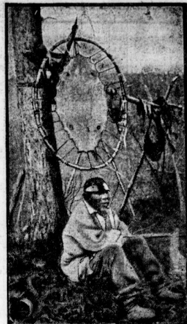
Heute findet man unter den Eingeborenen Beharnde indianer Ostindien, und Indianer. Inlet Bild zeigt einen solchen Indianer, der im Geäst des Baumes das Fell eines erlegten Widders an einer eigens dazu geschaffenen Vorrichtung zum Trocknen ausgehängt hat.

Der immense Reichtum Alaskas macht es ohne Zweifel zu einem der großen Zukunftsänder, das für die unter allen jetzigen Wäldern lebende, überfüllte alte und neue Welt ein solches der Verheißung ist. Alaska wird in absehbarer Zeit, wenn das Schatzgräber ansehnlich ist, eines der aufnahmefähigsten und zutunfähigsten Auswanderungsänder der Welt sein. Millionen von den Gold-, Silber- und Kupferminen, den Steinölen- und Kohlenlagern, birgt das Land unermeßliche Schätze. In hunderten von Meilen erstrecken sich Zinnen- und Klüftenwohnungen über durch das Land, und eine der furchtbarsten Aufgaben, die große Geber, hat in Alaska ihre Heimat. Der Reichtum an Bergwerken, der zwar durch die alljährlich einströmenden Lagerdepotitionen schon fast demisiert ist, verdrängt noch immer gewaltige Bergbauunternehmen. Eisen, Silber, Arsen, und Silbererz, brauner und