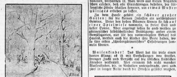
Die Waisenkinder beim Spiel im Garten.