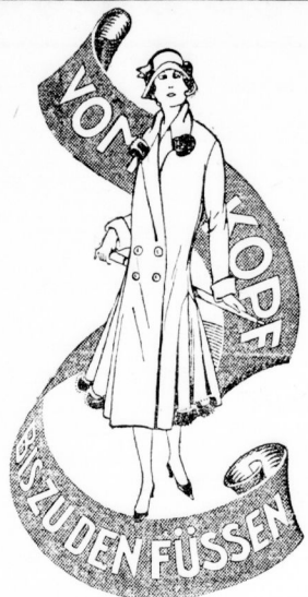
Glocken-Mäntel mit u. ohne Pelzbesatz 48 54 65 88

Spezial-Putz-Abteilung Zu jedem Mantel der passende Hut!