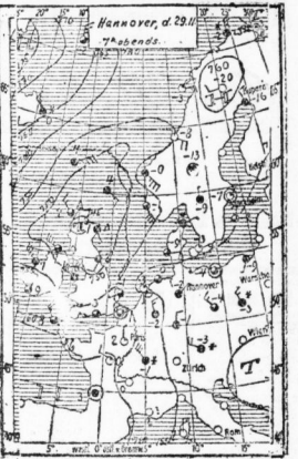
ERKLÄRUNG: G. Wolken, O. Nebel, G. Regen, G. Schnee...