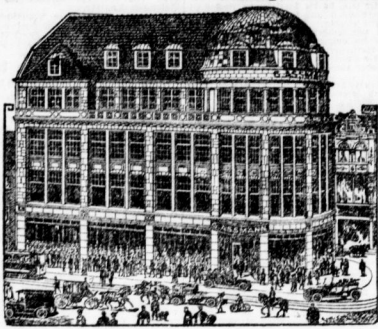
Stammhaus Gr. Ulrichstr. 49 • Gegr. vor 77 Jahren

Feine Herrenkleidung nach Maß Große Stoffauswahl • Garantie f. tadell. Sitz Anzüge nach Maß Hauptrollwagen, Mk. 115, 135, 155, 185,-