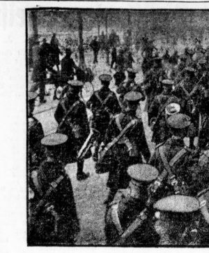
Der Beginn der Räumung von Köln. Der Komarak des Manchester-Regiments.

gehen gegen das Gesetz gefaßt haben, kommt es nicht selten vor, daß mehrere Gerichte zu gleicher Zeit den Anspruch auf die örtliche Zuständigkeit erheben können. An Abhilfen ist diese Frage anders zu entscheiden als im Strafprozeß.