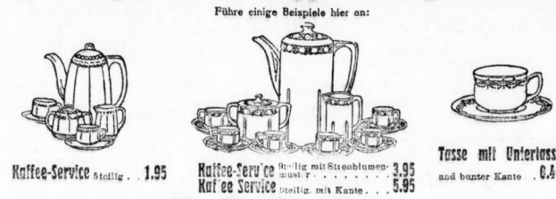
Kaffee-Service stattl. 1.95 Kaffee-Service stattl. mit Strahlenmuster 3.95 Tasse mit Unterleier und bunter Kante . 0.40