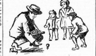
Das ist der alte Weihnachtsbaum, den ich schon damals, jung war, für die ersten drei Wochen...