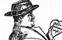
Wer Gottlieb sagt sich heute nicht bedürfen. Er sieht die Pfefferkuchendube hervor und reißt es wertlos seiner Beschäfte hin...