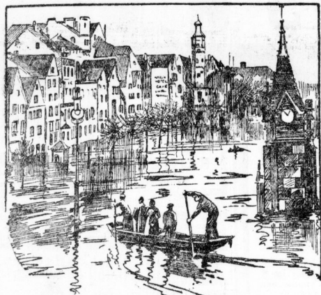
Die Altstadt Köln unter Wasser.

Auch aus Süd- und Mitteldeutschland werden die Nachrichten immer beunruhigender. Das Hochwasser der Donau hat an der Strecke Regensburg-Regensburg wurde gestern mittig am Pegel ein Stand von 855 Zentimetern erreicht. Das Hochwasser steigt weiter. Die Donau wurden durch Überschwemmung die Hochwasserstände. Auch für das bayerische