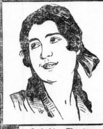
In beiden Theatern Verstärktes Orchester !!

und zahlen bis zu 14 Jahren Werktags bis 5 Uhr, Sonntags bis 4 Uhr auf allen Plätzen halbe Preise. — Am Freitag (Neujahr) und Sonntag, nachmittags 2.30 Uhr große Familien- und Jugend-Vorstellung! Jugendliche zahlen halbe Preise.