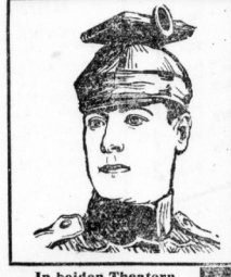
In beiden Theatern Verstärktes Orchester !!