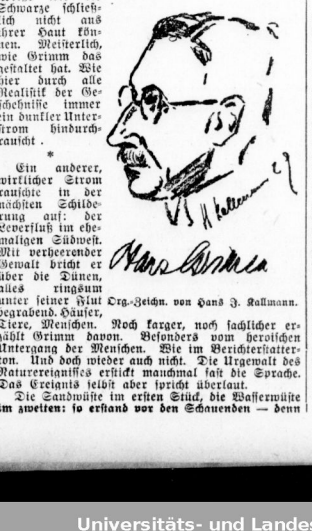
Portrait of a man, likely a political figure mentioned in the text.

Vertical text on the right edge of the page, possibly a page number or additional page information.