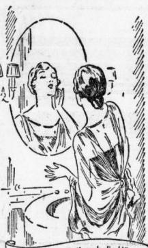
Macht Köchenarbeit rauh die Hände. Zur Pflege Zuckooh-Creme verwenden!

denn das Wohlbehagen, das sich auf den Gesichtern ihrer lieben Gäste malt, sagt ihr, wie gut ihr das Diner gelungen ist, und wenn sie auch allein selbst bereitet, so konnte sie doch ohne Scheu ihre Hand zum Willkommen reichen; denn die Spüren der Küchenarbeit sind beseitigt durch einen Hauch von Zuckooh-Creme, und der Hauch ist wieder glatt und sammetweich.