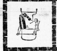
(links) Eine Hochleistungspumpe am Cartervergaser spritzt bei plötzlichem Niederdrücken des Gashebels eine kleine Kraftstoffmenge in die Mischkammer und sichert so schnellen Anzug auch in prekären Situationen.