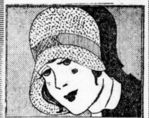
Elegante, moderne Glocke aus Hanfborde gearbeitet . . . 5.75