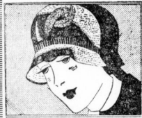
Vornehmer Frauenhut Florina mit Crêpe de chine . . . 11.75