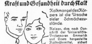
Kalkmangel des Körpers ist die Ursache vieler Schmachtschläge.

berühmte Schauspieler. berühmte Schauspieler. berühmte Schauspieler. berühmte Schauspieler.