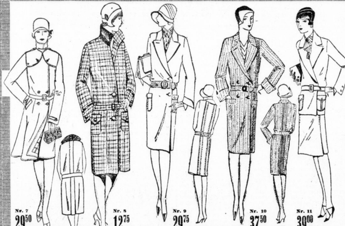
Nr. 7 29 50