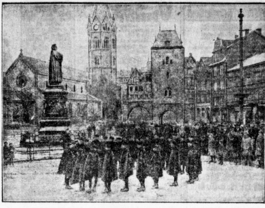
Die Ferrunde sagt vor dem Luther-Denkmal in Offenach. Die... ...der Ferrunde, die... ...der Ferrunde, die...