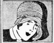
Sehr aparte Damen-Hut Spitzen-Neuheit . . . 9.50