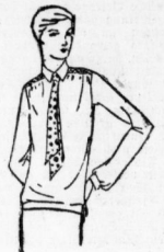
Moderner Kasak It. Bild aus Trikot-Charmeuse mit kleinen Falten . . . 9.75