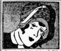
Eleganter Aufschlaghut Hanfborde mit Spitzen - Einsätzen . . . 9.75