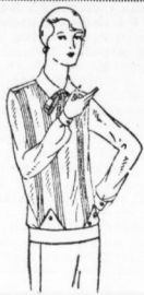
Eleganter Kasak It. Bild aus kunstleid. Wasch-Crêpe de Chêne in vielen modernen Farben . . . 11.75