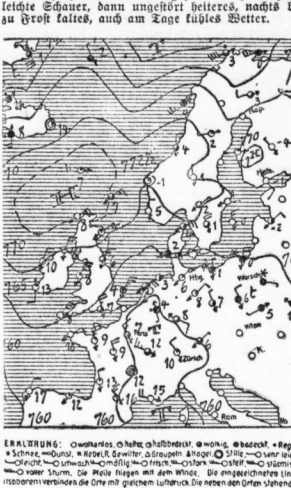
ERLEBNIS: Gewitter, 0. Heftig, 1. Stark, 2. Sehr stark, 3. Sehr heftig...