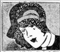
Fasche vielartige Strohhut- stumpen-Glocke . . . 9.75