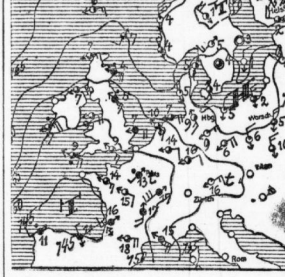
Die vorliegende Dr. der Hallischen Nachrichten (General-Anz.) umfasst 14 Seiten.