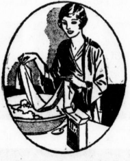
Die meisten Frauen kaufen die vorteilhafte doppelgroße Packung zu 90 Pfennig; Normalpackung 50 Pfennig.

Wo man Seide wirkt... wo man Strümpfe verkauft... überall raten die Fachleute— „Waschen Sie nur im weichen Schaum der Lux Seifenflocken!“