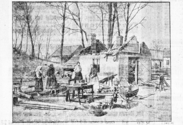
Das Greenwaldorf im Feuer nach dem Brand.