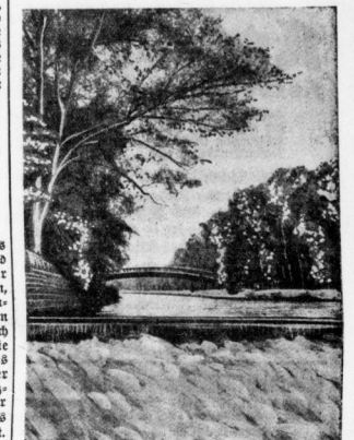
Im Anspart von Bad Neuenahr.

Eine Rhein-dampferfahrt etwa von Mainz bis Koblenz oder weiter hinauf bis Remagen, Kaiserslautern, Bonn und Köln gehört ebenfalls zum diesjährigen Fest zu den erlebnisreichen Naturerlebnissen. Mainz, die altgerühmte Komforth mit ihren tausendjährigen Erinnerungen, ihren reichen futurellen Schätzen und sonstigen Sehenswürdigkeiten, heißt den Wanderer, der auf großer Fingstien auszug und in ihren Wäbernden Einfahrt hielt, willkommen. Bingen, Badarsh, Oberwesel und Boppard, Eitelville, Ridesheim, Roth, Gaus, Braunshaus und wie die traumlichen, rebenumgebenen Städte und Städtchen alle heißen, die den schönsten Teil des Stromlaufes beschließen — sie sind geachtet, die Schönen der Fingstienwanderer von Was und Fern zu begrüßen und ihnen eine Mühnung von dem zu bieten, was den Rhein vor allen anderen Strömen auszeichnet, von seiner unverwehlichen Jugendkraft und seinem nie verlassenden Zauber.