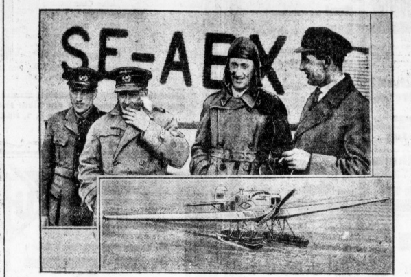
Der schwedische Fliegerkapitän Albin Ahrenberg mit dem Ozeanflug nach Amerika...