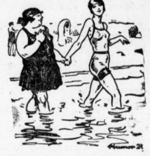
Es geht Ihnen gut an der See, gnädige Frau! Unbedingt, zwei Zücker habe ich schon absetzen können.

Leibbinden, alle Systeme, nach Maß bei Speer, Große Ulrichstraße 63.