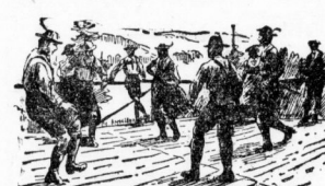
Der Schuhplattler wird geübt.

Ein besonderes Ereignis in ihrem oft recht eintönigen Leben bilden die Volksfeste. Dann lernt man die Leute auch von einer anderen Seite kennen. Es werden Feste veranstaltet, zu denen aus den Nachbarorten und -länden die Jünglinge und die Alten kommen, festlich gekleidet auf eben so festlich verzögerten Feiern, die oft von vier Wänden gesungen werden. Dann bricht die lange zurückgehaltene Fröhlichkeit durch und überall hört man lachen und singen. Oft sind auf dem Dorfanger mehrere Tanzplätze zurechtgemacht, und nun beginnt