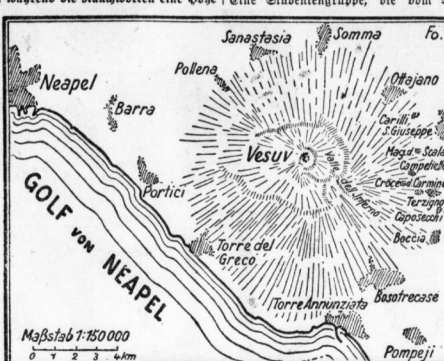
Map of the Vesuvius region showing the Gulf of Naples, Vesuvius, and surrounding towns like Neapel, Barra, and Pompeji.