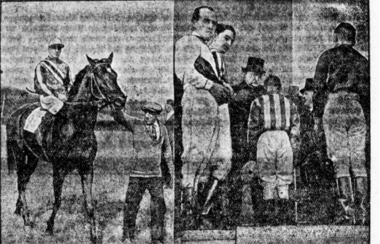
Das größte gesellschaftliche Ereignis des Berliner Turnfestes ist der Zug, an dem der Reichspräsident in Goppengarten als Gast teilnimmt...