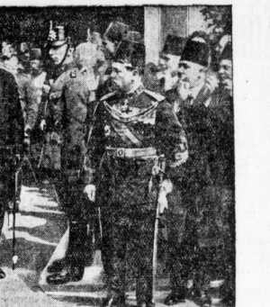
König Guad verläßt mit dem Reichspräsidenten die Ehrenhalle des Berliner Bahnhofs.