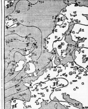
BAROMETRE: 0=normales, 1=hoch, 2=stark, 3=stark, 4=stark, 5=stark, 6=stark, 7=stark, 8=stark, 9=stark, 10=stark, 11=stark, 12=stark, 13=stark, 14=stark, 15=stark, 16=stark, 17=stark, 18=stark, 19=stark, 20=stark, 21=stark, 22=stark, 23=stark, 24=stark, 25=stark, 26=stark, 27=stark, 28=stark, 29=stark, 30=stark, 31=stark, 32=stark, 33=stark, 34=stark, 35=stark, 36=stark, 37=stark, 38=stark, 39=stark, 40=stark, 41=stark, 42=stark, 43=stark, 44=stark, 45=stark, 46=stark, 47=stark, 48=stark, 49=stark, 50=stark, 51=stark, 52=stark, 53=stark, 54=stark, 55=stark, 56=stark, 57=stark, 58=stark, 59=stark, 60=stark, 61=stark, 62=stark, 63=stark, 64=stark, 65=stark, 66=stark, 67=stark, 68=stark, 69=stark, 70=stark, 71=stark, 72=stark, 73=stark, 74=stark, 75=stark, 76=stark, 77=stark, 78=stark, 79=stark, 80=stark, 81=stark, 82=stark, 83=stark, 84=stark, 85=stark, 86=stark, 87=stark, 88=stark, 89=stark, 90=stark, 91=stark, 92=stark, 93=stark, 94=stark, 95=stark, 96=stark, 97=stark, 98=stark, 99=stark, 100=stark.

Ausichten: Vormittags im Nordteil des Bezirkes noch etwas Regen, dann aufklaren. Am Sonnabendvormittag heiter und Ermärnung, dann neue Bewölkungszugänge.