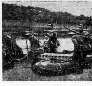
Der erste Brückenteil gleitet in die Saale.

Ein Pfiff . . . Ein Wink. Und es geschieht! Aus den Gehäusen brechen Pioniere. Sechs Mann tragen einen Steg auf vier Gummibooten. Fix und fertig zum Paraderlaufen. Und nochmals ein Wink. . . Die zweite Kolonne führt an. Wieder ein Steg mit Uebändern, Seilen. . . Damit gleiten Brückenteile ins Wasser. Aus zwei Stegen werden vier. Aus vier acht und damit eine halbe Brücke. Die halbe Brücke altert auf dem Wasser. Man zählt zwölf Stege, man zählt vierzehn. Jenseits stehen fröhliche Hände. Ueber die Mitte der