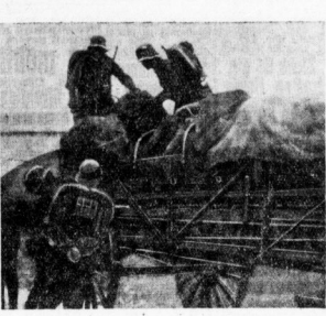
Das Material für die Schneelücke wird verladen.

Die Bedeutung wird noch größer. Der Soldat wird losgelöst. Er fällt sich in den Mittelnachteil. Und das ist heute noch so wichtig, vor und während des Krieges. Denn auch die Uniform lachlicher geworden ist. Und es ist auch noch so, daß man dem Militär ins Gelände nachspigert.