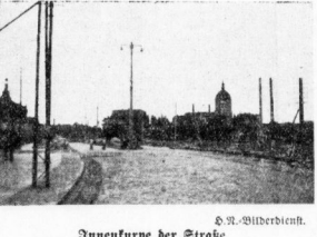
Innenkurve der StraÙe. Im Hintergrund eine Verkehrsinsel.

Die Arbeit auf dem Rathaus beginnt wieder. Die Arbeit auf dem Rathaus beginnt wieder. Die Arbeit auf dem Rathaus beginnt wieder. Die Arbeit auf dem Rathaus beginnt wieder.