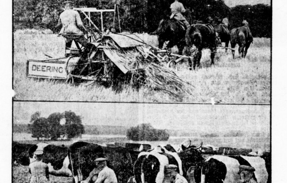
Abbildung in der Provinz-Landwirtschaftsschule in Gera.

• Diebe verurteilt in der Provinz. Ein Dieb ist bei Wuns dem Zuge gefährt und tödlich verunglückt. Ein Dieb ist bei Wuns dem Zuge gefährt und tödlich verunglückt.