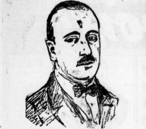
Der Börsennotizierer Mr. G. G. G.

Die Welt ist vernehmbar erschrocken über ein rasches Sinken des Londoner Börsenstands. Seit dem 17. September hat sich der Börsenstand in London rasch und stetig nach unten bewegt. Die Kurse der wichtigsten Aktien sind in den letzten vier Tagen um über 10 Prozent gesunken.