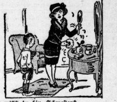
Wo müßt du hin, Schwester? In die Küche. (Gastwirt hat denn wirklich, daß du dem flecken Gott besser gefällst, wenn du geputzt bist?)

„Gammli-Strämpfe, Fußbinden bei Speer, Große Ulrichstraße 63.“