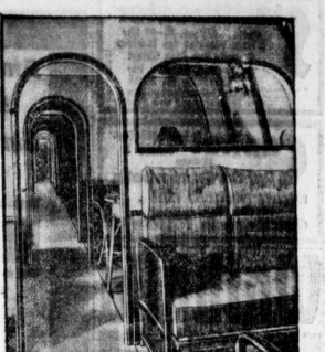
Ein Bild in die Adolvenwelt des Do X