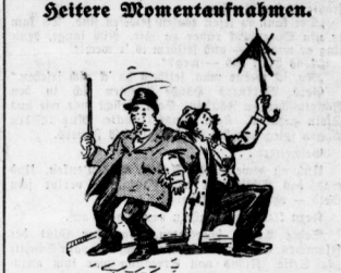
Sollte doch nicht den Regensturm so merkwürdig die Leute können glauben, wir sind betrunken...

Nachdem er ging Kommissar Müller an Werner's Seite über die Wunde. "Sind Sie fenne fenne?" "Eine charakteristische Gesichtslinie! Was für ein Gesicht, ist es letztlich wenig, das sich so auf wie nichts damit anfangen läßt. Sie vermögen gar nichts anzugeben, was auf eine Spur führen könnte?" "Nichts!" (Fortsetzung folgt.)