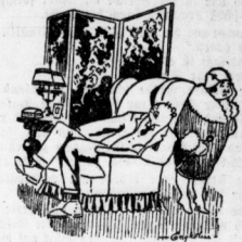
Hast du beim Bahnhalt geföhrt? No, als er mir die Rechnung zeigte."