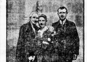
Das Kind, das im Winter 1912 in der Nähe von Stammen verlorene wurde.