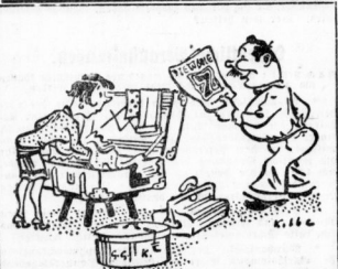
... Die Woche' brauchst Du nicht mitzunehmen. Die gibt's doch überall! ...