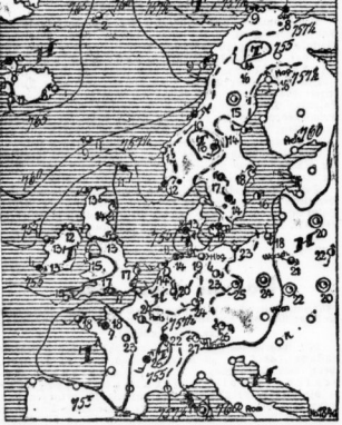
BRUNNEN: Die Wetterkarte zeigt die Wetterlage am 4. Juli 1929. Die Karte zeigt die Wetterlage in der Region um Halle, Leipzig und Dresden.