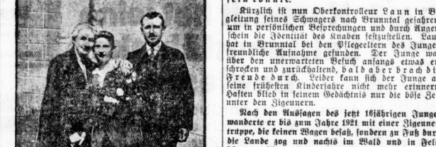
Das Kind, das im Winter 1912 in der Nähe von Stammen verlorene wurde.