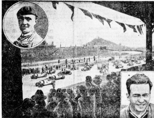
In der Mitte: Startbild auf dem Nürburgring. Links und rechts: Zwei Favoriten: Chiron (Bugatti) und Carraciola (Mercedes-Benz). Der große Preis der Nationen, der in mehreren Klassen ausgetragen wird, vereinigt eine große Anzahl internationaler Renngrößen auf dem Nürburgring, der berühmten Autorennstrecke in der Eifel.