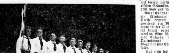
Die Teilnehmer der Fahrt.