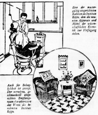
Auch für Bekleidungsstücke ist geeignet. Der vorurteillose, geschmackvolle, angenehme, empfindungsraumcharakteristische Duft von der bewährten Palmolive Seife.

Millionen Frauen haben in dieser täglichen 2-Minuten-Behandlung die Lösung des Problems der täglichen Schönheitspflege gefunden. Deshalb ist Palmolive in 48 Staaten die führende Teintseife — überall, wo Frauen nach schönem Teint streben, hören sie den immer wiederkehrenden Rat: „Waschen Sie sich zweimal täglich mit Palmolive-Seife“. Palmolive G. m. b. H., Berlin, Europahaus, Fabrik Hamburg.