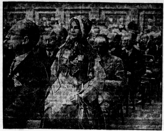
Die schwelgische Zubereitung unter den Gästen. Bei der feierlichen Eröffnung des Weltreflametangresses in Berlin...