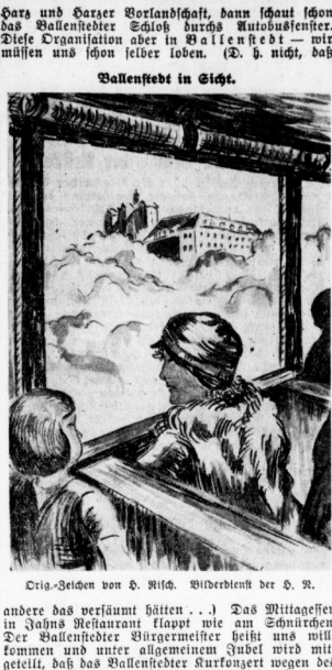
Die „Hallnawi“ in Halle.