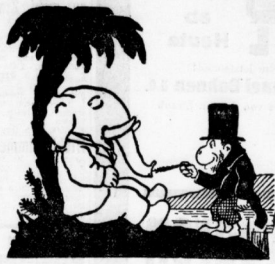
Der kleine Jumbo schläft im Gras; Fips jagt ihn an seiner Nale.