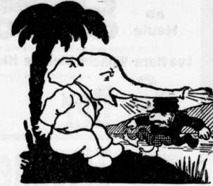
Das macht dem Jumbo viel Verdruß, weil er gewohnt ist zu sein. Er wird dadurch natürlich mürrisch; Der Witz lüftet den Berg gemürrisch.