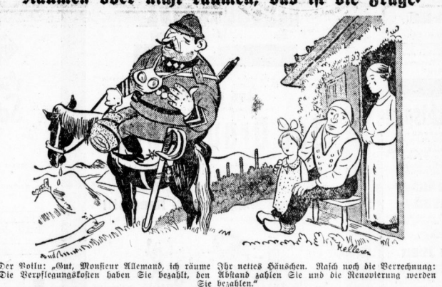
Der Welt: „Gut, Monsieur Allmand, ich räume die Welt aus, wenn Sie es wünschen. Sie und die Neuverteilung werden Sie befragen.“