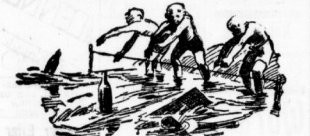
Wettspiel im Wasser mit Brettern und leeren Flaschen.

Das dritte Spiel ist, wie gesagt, auch ein Wettspiel. Dazu braucht ihr einige Stiefelböden und ebenso viele leere Bier- oder Weinflaschen. Auch