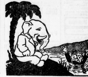
Ins Wasser purzelt er hinein. Man hört ihn laut um Hilfe schreien. Ja, wenn man ihn nicht errettet, hat dieser meistens nicht viel!