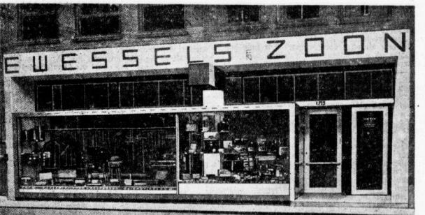
Rietvelt & Schröder, Utrecht / „Der gut belichtete Laden“