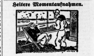
Seitene Momentaufnahmen. (Fortsetzung folgt.)

re angeheißt über Hilflosigkeit von dieser unfaßlichen... Wolke unerschütterlich zu erliegen drohen. Denn ob... wohl an mehr als vierhundert Stellen tiefste... Schiller angebracht waren, auf denen in allen Leben... denen Erdatzen der Menschheit geführten nach, daß... der Start des Weltkampfes am 21. Uhr 30 Minuten... würde - obwohl unzählige Tausender in den... Händen von 10 Minuten mit unerschütterlichem... Gleichmut daselbst verblieben, lebten die Hundert... tausende, die um den See verstreut waren, doch... unverwundet in der Angewohnheit, den großen... Kampfbild zu verfolgen, und der lächerlichste... Mensch - ein Hund, ein Güterweiser, das plötzliche... Aufheben einer Raube - genigte, das gesamte... Menschengebiet rund um den See in fockende Rava... zu verwandeln.