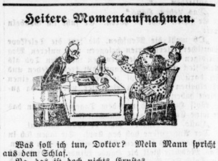
Was soll ich tun, Doktor? Mein Mann spricht aus dem Schlaf. ...