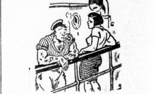
Wo bist du auf Laufe? Ach, wir Celeste fühlen uns in jedem Hafen an. Wo magst denn deine Bliesse? Du Laufe, selbstverständlich.