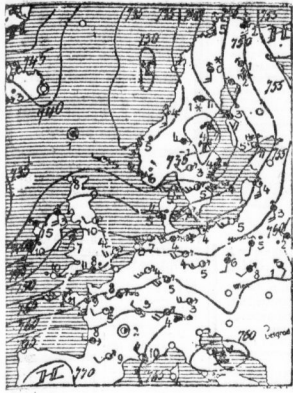
ERKLÄRUNG: Isobaren sind die Höhenlinien, die die Luftdruckverhältnisse angeben. Die Isobaren sind die Höhenlinien, die die Luftdruckverhältnisse angeben.