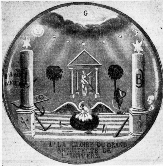
Was ist das? — Von wem ist das? — Wo befindet es sich im Museum?

Zagen, so besonders am vergangenen Sonntag wie am Dienstag (während der Abendklausuren), Redaktionen zu vergleichen. Wäre der Zufall der Zufälle, daß dabei freilich noch — der in Frage stehende Gegenstand war in der Tat nicht ganz selten zu finden — die Ähnllichkeit etwas vorzeitig ins Auge fiel, denn von den zur Ausgabe gelangten Manuskripten sind diesmal nicht alle an unsere Adresse zurückgekommen. Die Zahl der richtigen Antworten bleibt trotzdem sehr erfräulich, und wer in der vergangenen Woche vorzeitig auf die Suche ging, findet in der kommenden Heftausgabe noch ein oder zwei. Bei der vorliegenden Heftausgabe handelt es sich, wie der anmerkungswürdige Leser unserer Beilage schon erraten konnte, um kein Gemälde, obwohl es so aussieht, sondern um das Bild auf einer Platte eines Kasten, die von einem Künstler im Jahre 1870 in Halle in einer Straße des Museums aufbewahrt wird. Unter den Einwohnern ist dieses Bild das Los diesmal für folgende Preisträger: