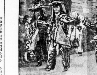
Der Umzug der Karren in Rotterdam mit ihren historischen Holzmassen.