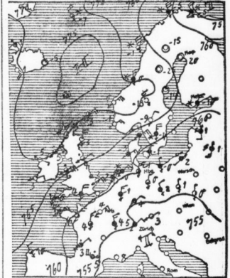
ERLEUTERUNG: Die Zahlen zeigen die mittlere Temperatur in Grad Celsius...