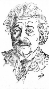
Professor Albert Einstein.