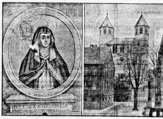
Ein Foto Roswitha von Sandersheim, die erste deutsche Dichterin, deren 1000. Geburtstag am 8. Februar in Sandersheim mit einer Festigung der deutschen Schriftstellerinnen begangen wird.

dem nötigen Verbinden, das auf dem Weg zu verschärfen. Wenn Sie mir mit einem Stück ausfallen können, lege ich gern zu Ihren Rechten —