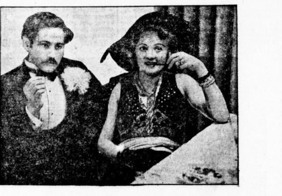
Josef v. Sternberg, der Regisseur von 'Unterwelt'...