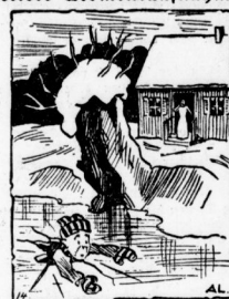
Die Mutter: Peter, komm nach Hause — — du bist ins Bad!