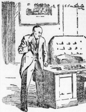
Sein Bild fiel auf den Revolver, der da mitten auf der Platte lag...

Der Morgen hatte die Entscheidung gebracht: die Macht von dem Bankrott einer Firma, an der man mit hohen Forderungen interessiert war, die Macht, daß im günstigen Falle mit einem Ausbeute von zehn bis zwanzig Prozent zu rechnen sei.