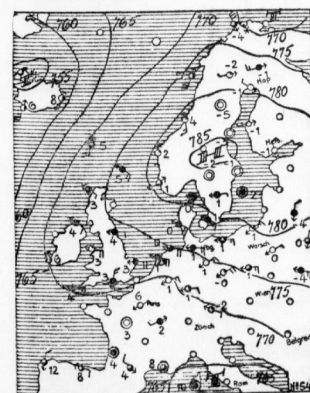
BAROMETRIE: Druckwert in hPa (1013 hPa = 760 mm). Windrichtung: Pfeile zeigen die Windrichtung an. Windstärke: Die Länge der Pfeile zeigt die Windstärke an. Temperatur: Die Zahlen zeigen die Temperatur in Grad Celsius an.

ost drehend. Hochdruck wieder in Wolken.