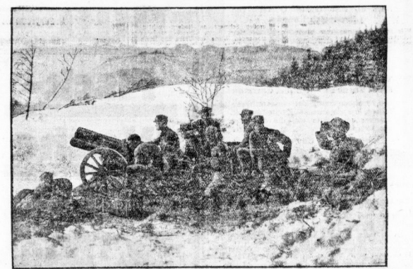
Häretiker in Stellung.

Das 7. (bayerische) Artillerieregiment unternahm am dem Geleisepfeil bei Vengrositz in Oberbavarn eine Übung größeren Stils.