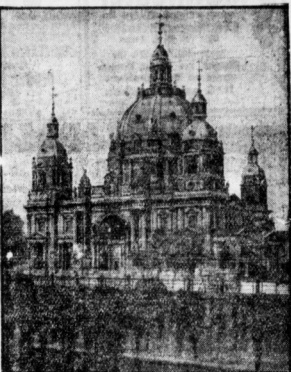
Der Berliner Dom, der in den Jahren 1894 bis 1905 im italienischen Gotikstil erbaut wurde...