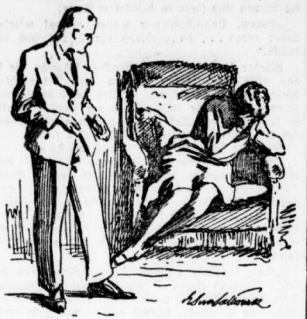
Und plötzlich vor ihr für einen Moment als ob mühsam zusammengebrochenen Gemüt über sich.

Wies, was sie miteinander erzielte, erließen ihm nun plötzlich in einem ganz anderen Maße. Ihre Sorge um ihn, ihre Güte, ihre Freundlichkeit, ihre Dürftigkeit... alles entsproh dem Reichtum einer Liebe, die unerschöpflich, unauflöslich war.