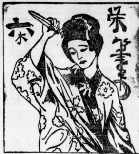
Ein Japanisches Plakat gegen die Selbstmordeuche mit der Unterschrift: „Geht nicht in den Tod aus Liebe!“

„Shinju“ gibt es seit der Einführung des Buddhismus in Japan. Dem Japaner erscheint es als ein Verbrechen, als ein Verbrechen der Untätigkeit, nur in der nächsten Welt —