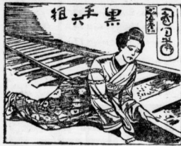
Ein Plakat mit der wannenden Unterschrift: „Tausende starben diesen Tod.“

Einmalamer Freiheit aus unglücklicher Liebe ist in Japan nichts Neues, und es ist keinesfalls richtig, wenn man annimmt, er sei früher selten gewesen. Aber die letzten Jahre haben eine geradezu erschreckende Häufung der Selbstmordeuche gebracht.