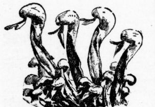
So harmlos sehen die Pflanzen aus!

Nächst verhält es sich mit dem Tandania , das in den Riesenwäldern Südspaniens, Marokkos und Portugals wächst. Die Blätter sind nicht rund, sondern lang, aber auch mit Drüsenhaare dicht besetzt, die am oberen Ende ein feines Köpfchen zeigen. Mit diesen langen feinen Insekten ein, rollen ihre Blätter um das gefangene Tierchen, töten und verdauen es durch die Drüsen. Nachdem dies geschehen, schließen sie sich wieder aneinander. In Nordamerika auf den sandigen Flächen Südamerikas sieht man viele die Venusfliegenfalle . Bei dieser Pflanze sind die Blätter besonders eigenartig. Sie gliedern sich in zwei Hälften. Der