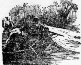
Nur der Scheinwerfer spielte unaufhörlich über die Fluten...

Eines Abends setzte mein Vetter eine Krokodiljagd in Szene. Er besetzte das Auto mit Stangen, Regen und Seilen und stellte eine schwere Büchse neben dem Führersitz. Mit Einbruch der Dunkelheit fuhren wir los. Meine Vetter hatte ganz auf das zweifelhafte Vergnügen, wie sie diese nächtliche Expedition nannte, verzichtet, und wir drei Europäer — der dritte war ein Freund meines Veters — waren mit den vier malayischen Boys und dem Jagdgerät eine ausreichende Besatzung für den Wagen. Fort ging es durch die tiefschwarze Nacht einem der