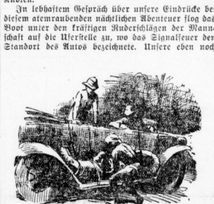
Der Kadaver wurde auf das eine Trittbrett des Wagens gehoben...

In lebhaftem Gespräch über unsere Einbrüche bei diesem atemberaubenden nächtlichen Abenteuer flog das Boot unter den fröhlichen Aufdringeln der Mannschaften auf die Tretboots an, wo das Signalhorn den Standort des Autos bezeichnete. Untere eben noch