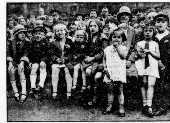
Dem Fotografen ist diese reizende Aufnahme bei einer Freilicht-Ballett-Vorführung für die Schulpolizisten und ihre Angehörigen gelungen. Kinder sind die begeisterten Zuschauer, und von ihren Gesichtern ist deutlich Vergnügen, Spannung und Bewunderung abzulesen, mit denen sie den Darbietungen der Afrobaizen folgen.