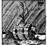
Wie es geht! Heute sehe ich wahrscheinlich keinen Fuß vor die Tür!