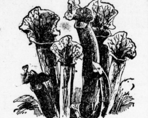
Fleischfressende Pflanze mit ihrem Nachbarn

Woh — wie sich das anseht! Pflanzen als Raubtiere! So etwas gibt es doch nur in Märchen, wird man sagen. Aber es ist kein Märchen! Es gibt tatsächlich einige Pflanzenarten, die sich, wie wir fogelich sehen, als wahre Raubtiere entpuppen. Die Pflanzen, von denen wir hier sprechen, pflegen sich nämlich nicht wie freilebende zu ernähren, sondern versetzen richtige tierische Beutetiere, wie zum Beispiel Insekten. Die Wurzel dieser fleischfressenden Pflanze sind wenig verzweigt und erreichen meist nur geringe Länge. Ihre Blätter entspringen sich als dicke, schlanke, fruglosig, krausenartig oder rund. Am bekanntesten ist „Sonnentau“, der nicht selten auf Mooren zu sehen ist. Seine Blätter sind