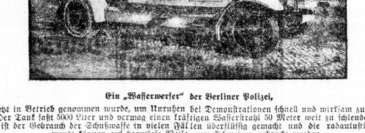
Ein „Wasserwerker“ der Berliner Polizei.

Die Berliner Polizei hat eine Methode entwickelt, um Wasser gegen Diktöpfe zu verwenden. Die Berliner Polizei hat eine Methode entwickelt, um Wasser gegen Diktöpfe zu verwenden.