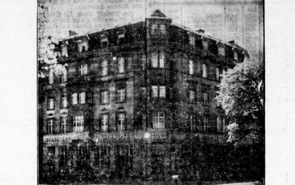
Die Sparkasse im neuen Heim.