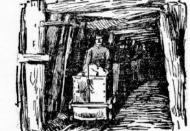
Ein langer Stollen, in dem die Bergleute das in die Hände geladene Erz oder die Kohlen bis zum Fördererfahren

Viele Gefahren bestehen hauptsächlich in den sogenannten fallenden Gesteinen. Das sind Gesteine, die sich dort unten bilden und sich auf irrtümliche Weise entsenden und somit eine oft schreckliche Zerschmetterung durch Explosion verursachen. Man sucht sich vor ihnen dadurch zu schützen, daß Vertiefungen angelegt sind bis hinunter in den Schacht gedrückt wird und die auf der anderen Seite die in die Höhe, mit Gestein angefüllte Luft hinauf, die Erdoberfläche abfließen. Früher mußte der Bergmann auf langen Leitern hinabsteigen, die seit jenem Zeit von der Erdoberfläche