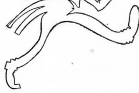
Der „moderne“ Dackel

Das Bild heisst „Ein Zug zu zeichnen“. Das ist ein Bild, das Sie zeichnen sollen. Sie sollen es in einem Zug zeichnen. Das ist ein Bild, das Sie zeichnen sollen. Sie sollen es in einem Zug zeichnen. Das ist ein Bild, das Sie zeichnen sollen. Sie sollen es in einem Zug zeichnen.