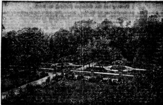
Partie im Wälsarten. Im Hintergrunde der Turm der Wälsarten.

In angenehmen Spaziergängen laden auch die Grünflächen ein, die sich an beiden Ufern der Saale hinziehen. Sie alle bieten mit ihren wohlgepflegten Wegen Orte der Erholung und Ruhe, wo die und manche Größe bewachen kann. Zu-