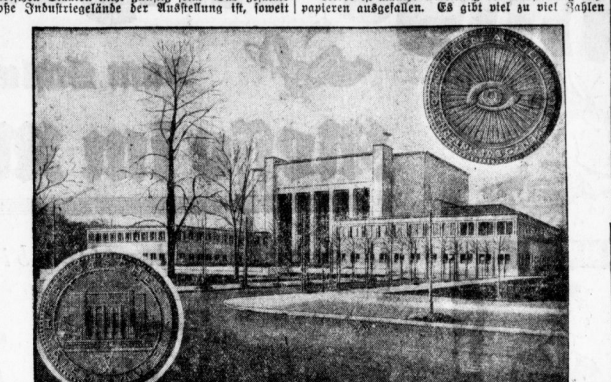
Das Hygiene-Museum, der Mittelpunkt der Ausstellung...