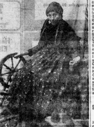
Eine Dantzerocerin am Spinnrad.