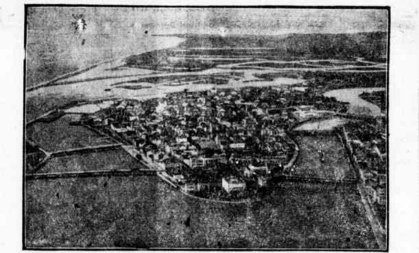
Die brasilianische Stadt Fernambuco, die der Sülfleurer nach der Ueberzeugung des Atlantischen Ozeans zunächst antizipiert wird, am dann der 8. Juli 1929 in die Welt...