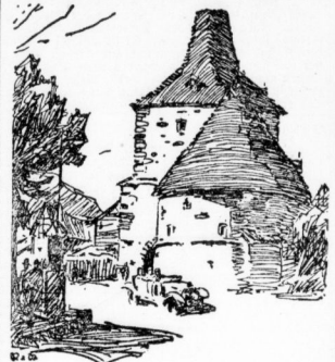
Das Breite Tor in Goslar.

ist, das mir auf derselben Wanderung möglich erreichen, ist entzückt in beiderer Schönheit. Im Oberharz stellt immer wieder von neuem das Wolfsschädel, das Hoheneck und