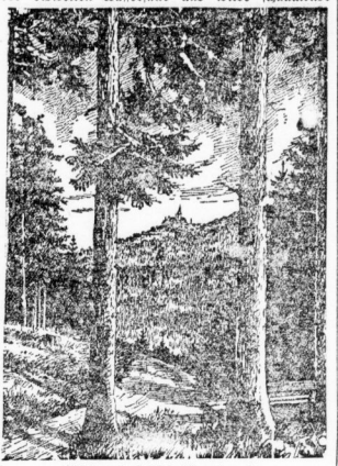
Bild am Schloß Wernigerode.

Hütern und still anstehend über den Sommerberg durch das wenig begangene Bismarcktal nach Teufelsberg. Unter den Seitenhängen des Teufelsbergs kommt für den Wanderer noch das Bismarcktal in Betracht. Ist das Bismarcktal schon still zu nennen, so kann man das Teufelsbergtal als fast unheimlich ruhig bezeichnen. Schreit es einen, wenn auch „antik-romantischer“ Umgang von eigenen Tälern nach Bismarcktal drückt, ist mir hier auf überausigen Wanderungen nur einmal ein Mensch, ein Waldarbeiter, begegnet.