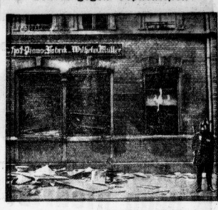
Ein demokratisches Geschäft in Mailand.