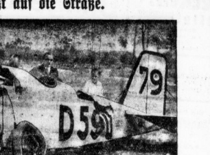
Das geräumte Flugzeug D. 500 von der Verkehrsanstalt für Luftfahrt stürzte über dem Berliner Zoo vor Johannisplatz ab und geriet auf die Straße. Der Pilot und sein Begleiter wurden erheblich verletzt.