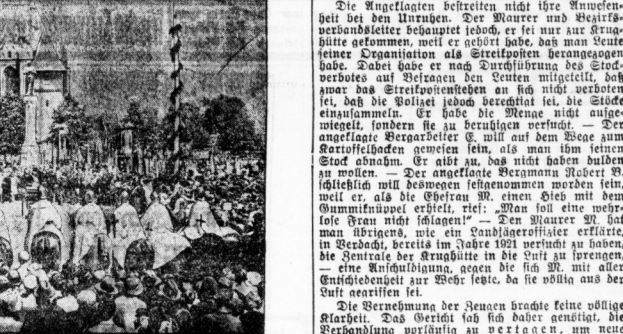
Die Abstimmungsfeiern in Marienburg.

Die Abstimmungsfeiern in Marienburg, die im vergangenen Jahr in der Abstimmungsfeiern stattfanden.