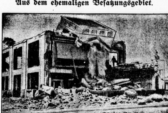
Aus dem ehemaligen Befestigungsgebiet. Das geprengte Verwaltungsgebäude auf dem Flugsplatz haben die Arbeiter (Mitte). Noch immer bereitet das abgerückte Deutschland den Eisen- und Stahlbedarf für die Rüstung. Die Verwaltungsgebäude sind geprengt und der Flugsplatz ist mit einem Schuttbauwerk bedeckt, um das Gelände unbrauchbar zu machen.

Der Grund ihres Wertes ist offensichtlich ein anderer. Betrachtet man die ursprüngliche Form der Edelsteine, so bemerkt man bei fast allen die ebenfalls gemachte Gestalt. Diamanten bilden vierseitige Doppelpyramiden oder Prismen — Rubine