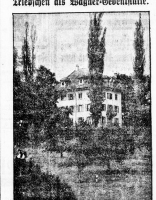
Das Bankgut Zriebischen bei Uenzen am Stierwaldhüttersee soll zu einer Gedenkstätte für Richard Wagner ausgebaut werden...