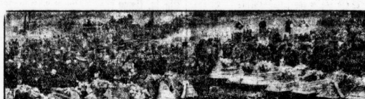
Die Neider der 80 Särgen in der Gräber auf dem Friedhof von Hausdorf.